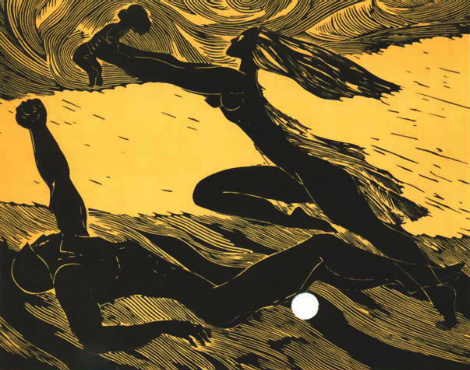
БОРЬБА. Гравюра С. Крассаускаса